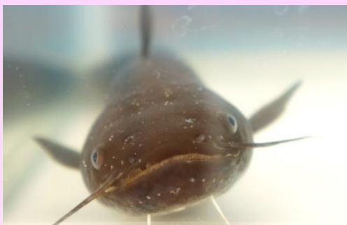
マナマズ<ニホンナマズ> (日本に分布する4種のナマズ属種の1種)