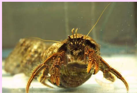
ソメンヤドカリ (昨年11月に脱皮、脱皮殻も展示中)

化石の発掘やガーネット(石榴石)などの鉱物採集に親子で楽しくチャレンジしてみませんか! 詳しくは、裏面をご覧ください。 また、館内に展示している化石や鉱物などは 入館無料 で見学できますので、自由研究の参考にしてください。