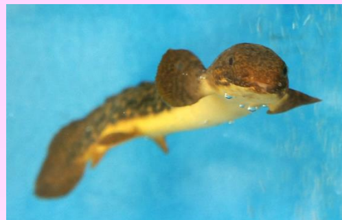
ポリプテルス・パルマス・ポーリー (4億年前に出現したと考えられる古代魚)