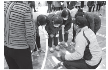
さぬき市婦人団体連絡協議会ポッチャ大会

さぬき市スポーツ推進委員会は、実技・研修会や機関誌の発行などを行っています。「さぬき市へんろ88ウォーク」や参加者の体力に応じた「ニュースポーツ教室(キンボール・ポッチャ等)」を企画・実施しています。