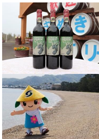
さぬき市 さぬきワイナリーのさぬきワイン 公式マスコット「さっきー」