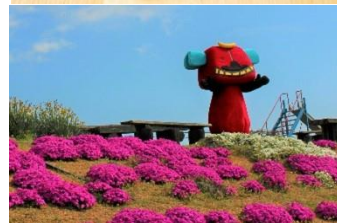
三木町 danran のエッグベリー・フィナンシェ PR キャラクター「舞ちゃん」