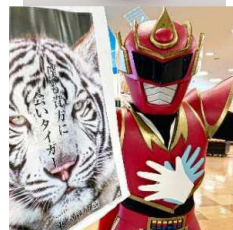
東かがわ市 (株)かめびしの三年醸造醤油 ご当地ヒーロー「てぶくろマン」